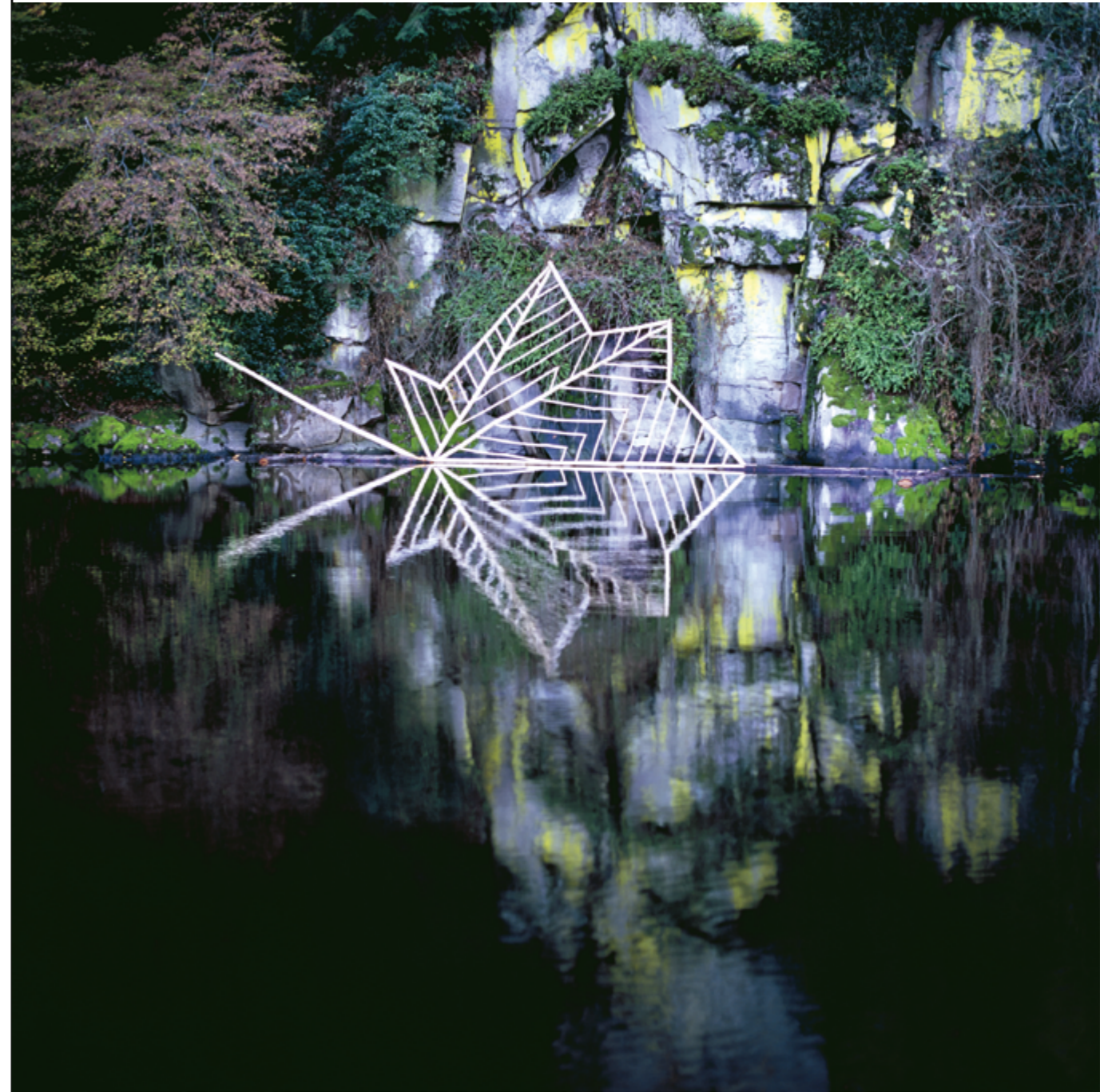
NILS-UDO, RADEAU D'AUTOMNE X , BRANCHES DE CHÂTAIGNIER ÉCORCÉES ET TRONCS DE DOUGLAS, ARCHIVAL PIGMENT PRINT, 150 × 150 CM, 2012, CROZANT (CREUSE), COMMANDE D'ÉGUZON-CHANTÔME, EN PARTENARIAT AVEC LA COMMUNE DE CROZANT, AVEC LE SOUTIEN DU MINISTÈRE DE LA CULTURE.

En liaison avec le cabinet du ministre de la Culture, la DGCA concourt à la définition de la politique du gouvernement dans le domaine des arts plastiques et du spectacle vivant. Elle la coordonne et l'évalue en l'inscrivant dans une logique plus large d'aménagement et de développement du territoire. Ses missions couvrent, dans les domaines relevant de ses compétences, le soutien à la création, l'aide à l'insertion professionnelle, l'enrichissement des collections publiques, l'élargissement des publics et des réseaux de diffusion. Au sein de cette administration centrale, le pôle de la commande artistique pilote les dispositifs nationaux que sont le 1 % artistique, la commande publique et l'aide à la commande, la charte spécifique à la commande privée appelée « 1 immeuble, 1 œuvre », et organise le Conseil national des œuvres dans l'espace public dans le domaine des arts plastiques. Les conseillers pour les arts plastiques des DRAC qui accompagnent les projets peuvent solliciter l'expertise et le conseil de la DGCA à toute étape d'un projet.