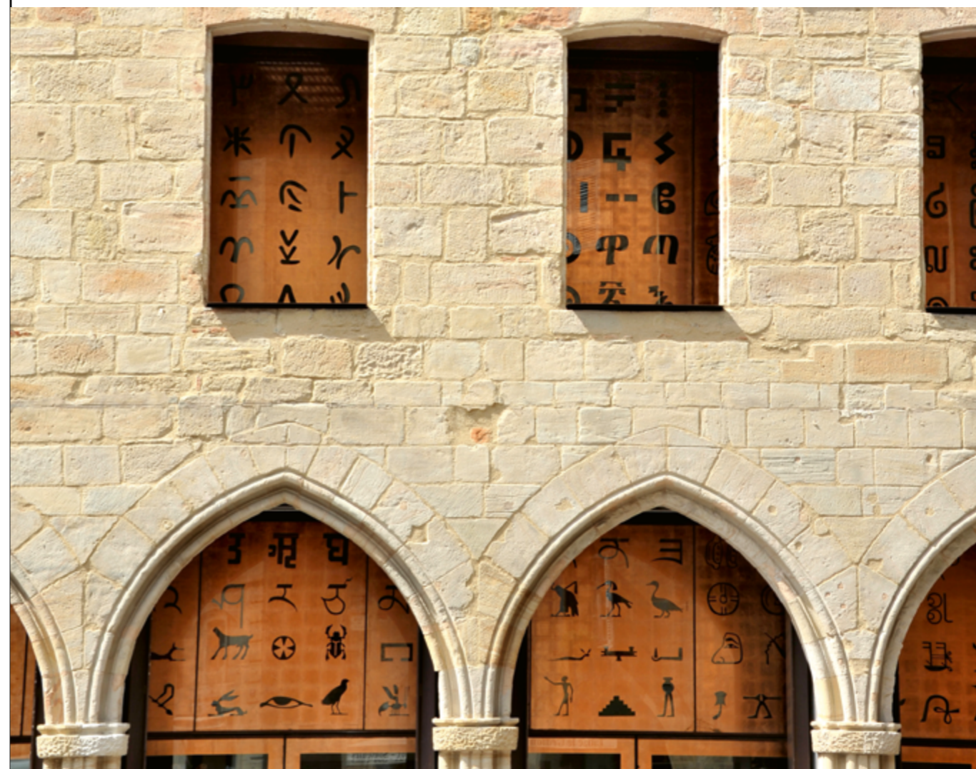
PIERRE DI SCIULLO, LA FAÇADE AUX MILLE LETTRES, 2003, MOUCHARABIEH TYPOGRAPHIQUE POLYLOTTE, MUSÉE CHAMPOLLION, ARCHITECTES MOATTI-RIVIÈRE, FIGEAC (LOT), COMMANDE DE LA VILLE DE FIGEAC AU TITRE DU 1 % ARTISTIQUE.

Il est conseillé d'organiser la communication, par voie numérique ou papier, en amont de l'installation pour préparer sa présentation publique. Tous les documents doivent être validés par le ministère avant diffusion et comporter son logo. Pour toutes les commandes artistiques, les services du ministère de la Culture peuvent être amenés à demander des images de l'œuvre pour la communication événementielle liée à l'inauguration et les relations avec la presse régionale, nationale et internationale. Le respect du droit d'auteur, notamment des droits de reproduction et de représentation, est impératif, son absence pouvant mettre en cause l'État et les collectivités dont l'exemplarité sur le terrain de la propriété intellectuelle doit être incontestable.