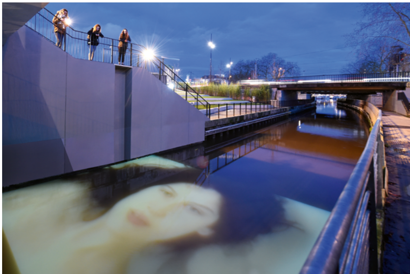
ANGE LECCIA, NYMPHÉA, 2007, PROJECTION VIDÉO, NANTES (LOIRE-ATLANTIQUE), COMMANDE D'« ESTUAIRE » DANS LE CADRE DE LA MANIFESTATION DE 2007.

européenne (JOUE). La publicité peut être faite sur le profil acheteur. L'objectif est d'avoir la publicité la plus adaptée au projet et d'en assurer la plus grande diffusion auprès des candidats potentiels.