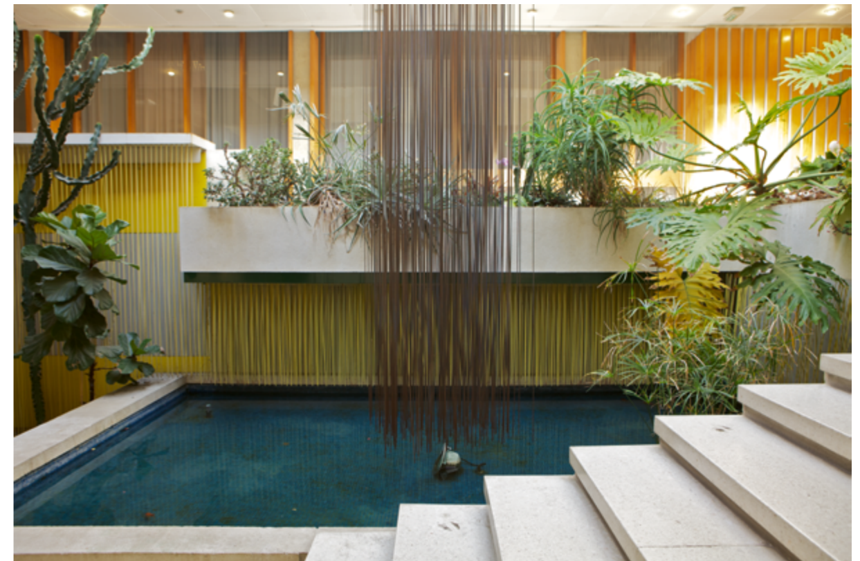
JESÚS RAFAEL SOTO, SANS TITRE, 1970, SCULPTURE SUSPENDUE ET DEUX MURS CINÉTIQUES, TIGES EN DURAL POLYCHROME, UNIVERSITÉ DE RENNES 1, ARCHITECTE LOUIS ARRETCHE, RENNES (ILLE-ET-VILAINE), COMMANDE DU MINISTÈRE DE L'ÉDUCATION NATIONALE AU TITRE DU 1 % ARTISTIQUE.

Maintenir l'identification de l'œuvre dans le temps demande une transmission de l'information qui peut se faire en installant un cartel, un panneau d'interprétation accessible à tous, une signalétique spécifique, en publiant une plaquette ou en organisant des actions culturelles (rencontre, parcours de visite, concours photos, etc.). Une bonne connaissance des œuvres favorise leur préservation, leur appropriation et leur valorisation. Les Archives nationales possèdent l'ensemble des documents relatifs au 1 % artistique conservés par le ministère de la Culture jusqu'en 1993. Le Cnap conserve de son côté la documentation relative aux commandes publiques artistiques soutenues par le ministère de la Culture ou commandées par l'État depuis 1983. Le ministère de la Culture (DGCA) et chaque DRAC disposent d'une liste des projets ayant bénéficié de son accompagnement. Chaque commanditaire est responsable de la procédure qu'il engage et tenu de conserver les documents qui y sont attachés.