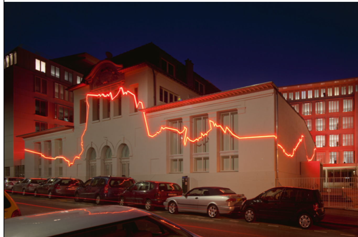
ANGELA DETANICO ET RAFAEL LAIN, LA CEINTURE DE FEU, 2010, AMO AGENCE PIÈCES MONTÉES, INSTALLATION LUMINEUSE, NÉON ROUGE, INSTITUT DE PHYSIQUE DU GLOBE, ARCHITECTE ATELIERS LION ASSOCIÉS, PARIS (ÎLE-DE-FRANCE), COMMANDE DU MINISTÈRE DE L'ENSEIGNEMENT SUPÉRIEURE ET DE LA RECHERCHE AU TITRE DU 1 % ARTISTIQUE.

Les maîtres d'ouvrage qui ne sont pas tenus d'appliquer le dispositif du 1 % peuvent néanmoins s'y soumettre volontairement. Par souci de sécurité juridique, il est préconisé de respecter scrupuleusement la procédure, y compris lorsqu'elle est facultative.