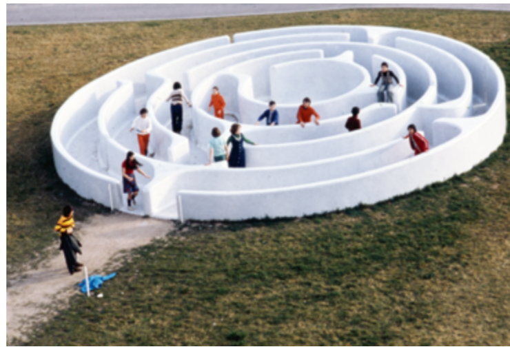
MARTA PAN, LABYRINTHE , 1973, BÉTON REVÊTU DE TESSELLES EN ÉMAUX DE BRIARE, LYCÉE MADAME-DE-STAËL, ARCHITECTE JEAN DUBUISSON, MONTLUÇON (ALLIER), COMMANDE DU MINISTÈRE DE L'ÉDUCATION NATIONALE AU TITRE DU 1 % ARTISTIQUE (PROPRIÉTAIRE ACTUEL : CONSEIL RÉGIONAL D'Auvergne).

Le droit moral, qui impose le respect de l'œuvre, permet à l'auteur de s'opposer à sa modification. Ainsi, pour toute intervention, y compris un changement d'emplacement, si l'œuvre a été conçue pour un site spécifique, il faut obtenir au préalable son accord ou celui de ses ayants droit.