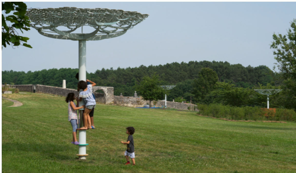
YVES CHAUDOUËT, LA RONDE DES OMBELLES, 2019, SEPT MODULES EN MÉTAL ET PORCELAIN, POMPÉJAC (GIRONDE), COMMANDE DE LA COMMUNE DE POMPÉJAC DANS LE CADRE DE L'ITINÉRAIRE « LA FORÊT D'ART CONTEMPORAIN », AVEC LE SOUTIEN ET L'ACCOMPAGNEMENT DU MINISTÈRE DE LA CULTURE.

validé par une commission régionale ou nationale. Les trente compositions monumentales du peintre Reynold Arnould et sa conception globale de la coloration de l'École nationale d'enseignement technique dans le quartier de Caucriauville au Havre (1961-1971) répondaient à la rationalité des trames de l'architecture fonctionnelle de Bernard Zehrffuss. La complicité entre les acteurs des différentes disciplines ont engendré de magnifiques synthèses des arts. Mais pour plus d'ouverture et d'équité, il a été décidé de remplacer ce système par un choix collégial.