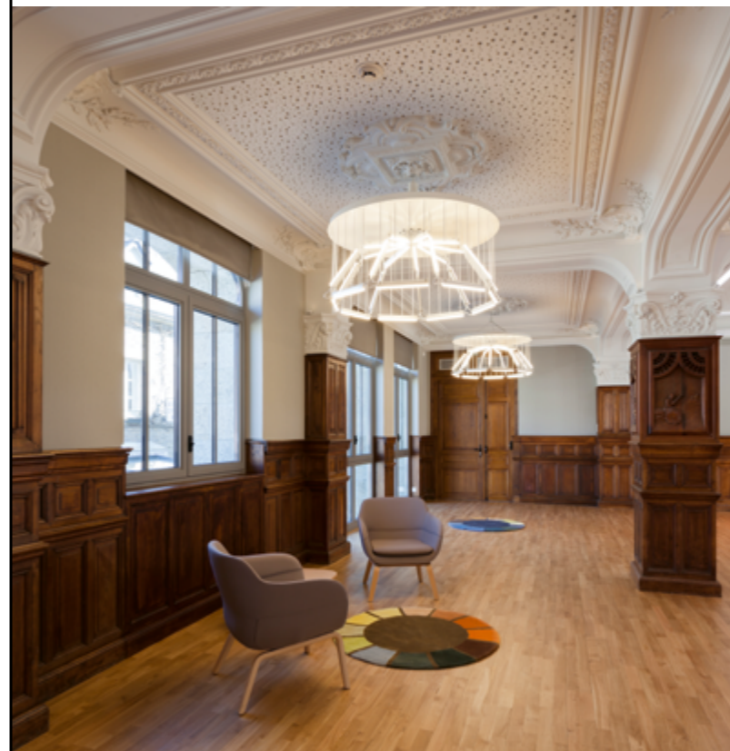
MATALI CRASSET, INTERACTIONS CHROMATIQUES, 2016, AMO BUREAU DES PROJETS, MUSÉE DE PONT-AVEN (FINISTÈRE), COMMANDE DE CONCARNEAU CORNOUAILLE AGGLOMÉRATION AU TITRE DU 1 % ARTISTIQUE.

d'Émile Bernard, de Paul Sérusier et de Maurice Denis, dont j'ai créé les palettes imaginaires. Chaque palette a pris la forme d'un tapis disposé sous un lustre comme si c'était sa projection au sol. J'avais l'idée de donner envie aux visiteurs de découvrir quelle peinture se cache derrière chacune de ces gammes chromatiques. La collaboration, l'installation, la médiation avec le musée, la conservatrice et toute son équipe ont été de beaux moments de partage et d'échange.