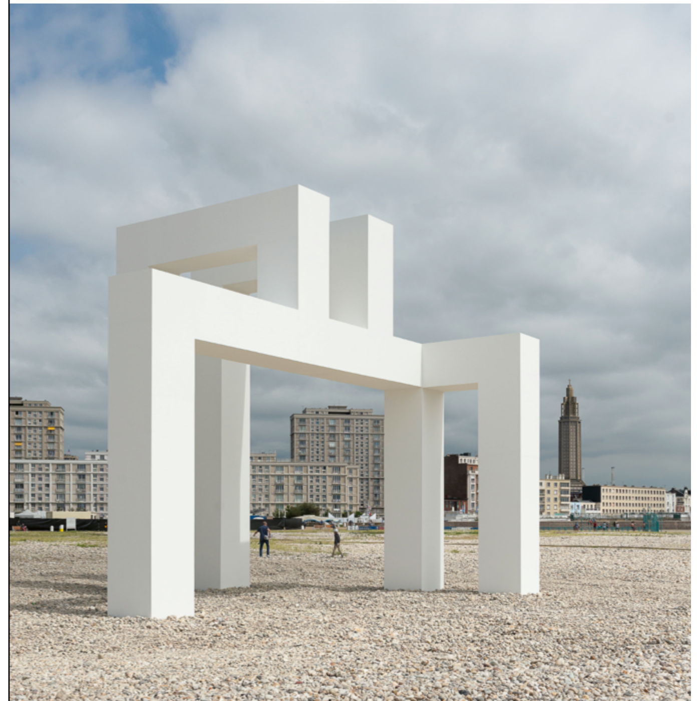
LANG/BAUMANN, UP #3 , 2017, ŒUVRE RÉALISÉE DANS LE CADRE D'« UN ÉTÉ AU HAVRE » PUIS PÉRÉNNISÉE, LE HAVRE (SEINE-MARITIME), COMMANDE DU GIP LE HAVRE 2017 AVEC LE MÉCÉNAT DE VINCI CONSTRUCTION FRANCE ET SA FILIALE GTM NORMANDIE.

Un commanditaire peut solliciter le ministère de la Culture dans le cadre du dispositif de soutien à la commande publique. Pour cela, il se tournera vers la DRAC qui étudiera les possibilités d'accompagnement artistique, technique et financier. Cette aide peut porter sur les études et/ou la réalisation ainsi que sur la communication (médiation, édition d'un ouvrage) ou la valorisation. Les demandes sont examinées par le Conseil national des œuvres d'art dans l'espace public dans le domaine des arts plastiques (organisé par la DGCA) qui émet un avis consultatif sur l'opportunité pour le ministère de soutenir le projet et peut conseiller le commanditaire sur tous les aspects de la démarche. Si le commanditaire souhaite être aidé pour le financement des études artistiques, il présente son projet (contexte, préprogramme, partenaires) au Conseil avant la publication de l'appel à candidatures. Ce Conseil est composé de cinq représentants de l'État (le directeur général de la création artistique, qui en assure la présidence, le directeur général des patrimoines, le chef de l'inspection de la création artistique de la DGCA, le directeur du Cnap, le directeur général de l'aménagement, du logement et de la nature), de deux représentants des collectivités territoriales (l'Association des maires de France et l'Association des régions de France), d'un directeur régional des affaires culturelles, de deux conseillers pour les arts plastiques, d'un conservateur du patrimoine,