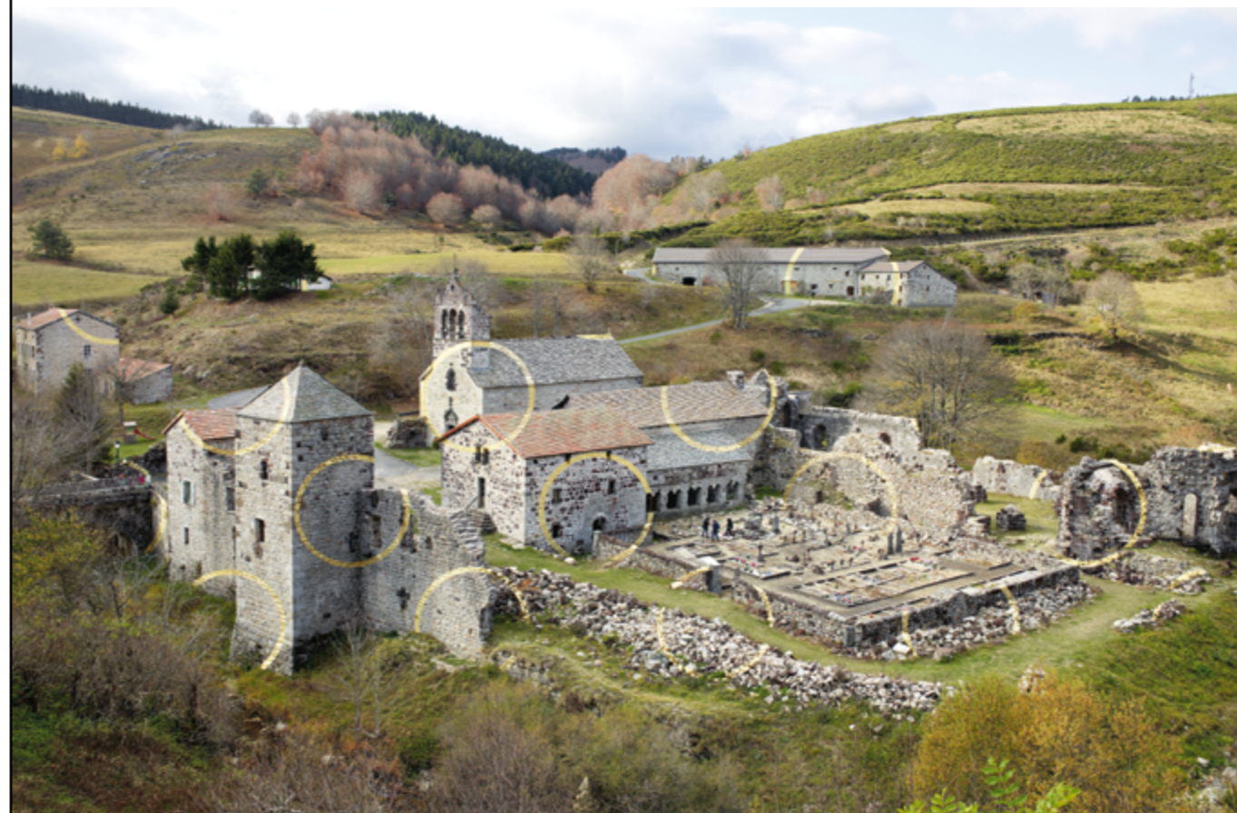
FELICE VARINI, UN CERCLE ET MILLE FRAGMENTS , 2017, INTERVENTION À LA FEUILLE D'OR SUR LES RUINES DE L'ABBAYE DE MAZAN, MAZAN-L'ABBAYE (ARDÈCHE), COMMANDE DU PARC NATUREL RÉGIONAL DES MONTS D'ARDÈCHE DANS LE CADRE DU PROGRAMME « LE PARTAGE DES EAUX » AVEC LE SOUTIEN DU MINISTÈRE DE LA CULTURE.

Les articles L.2194-1, R.2194-1 à R.2194-10 du code de la commande publique prévoient une liste limitative de cas dans lesquels il est possible de modifier le marché en cours d'exécution, par exemple lorsque des travaux supplémentaires sont devenus nécessaires.