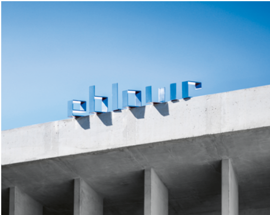
RAPHAËL DALLAPORTA ET PIERRE NOUVEL, ÉBLOUIR/OUBLIER , 2019, SCULPTURE INOX INTERAGISSANT AVEC LE SOLEIL, 230 x 50 x 30 CM, ÉCOLE NATIONALE SUPÉRIEURE DE LA PHOTOGRAPHIE, ARCHITECTE MARC BARANI, ARLES (BOUCHES-DU- RHÔNE), COMMANDE DU MINISTÈRE DE LA CULTURE AU TITRE DU 1 % ARTISTIQUE.