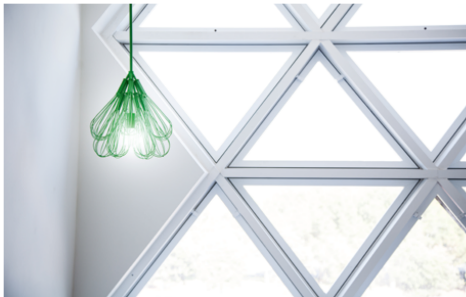
MATALI CRASSET, ÉMULSION, 2012, AMO AGENCE PIÈCES MONTÉES, LYCÉE GEORGES-FRÉCHE, ARCHITECTE MASSIMILIANO FUKSAS, MONTPELLIER (HÉRAULT), COMMANDE DE LA RÉGION LANGUEDOC-ROUSSILLON AU TITRE DU 1 % ARTISTIQUE.