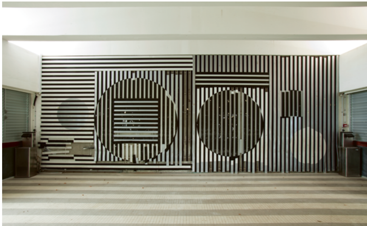
VICTOR VASARELY, INTÉGRATION INTÉRIEURE , 1972, REVÊTEMENT EN MÉTAL, COLLÈGE CHARLES-DE-GAULLE, ARCHITECTES RAYMOND CREVAUX ET JACQUES TESSIER, MORNE-À-L'EAU (GUADELOUPE), COMMANDE DU MINISTÈRE DE L'ÉDUCATION NATIONALE AU TITRE DU 1 % ARTISTIQUE (PROPRIÉTAIRE ACTUEL : CONSEIL GÉNÉRAL DE GUADELOUPE).

Dans le cas du 1 % artistique, l'architecte du bâtiment dispose aussi de droits moraux et patrimoniaux sur sa réalisation. Par conséquent, les reproductions de l'œuvre sur lesquelles le bâtiment est visible supposent qu'un contrat de cession de droits a aussi été conclu avec l'architecte.