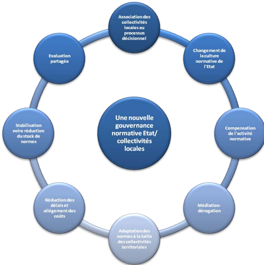
Schéma pour une nouvelle gouvernance normative